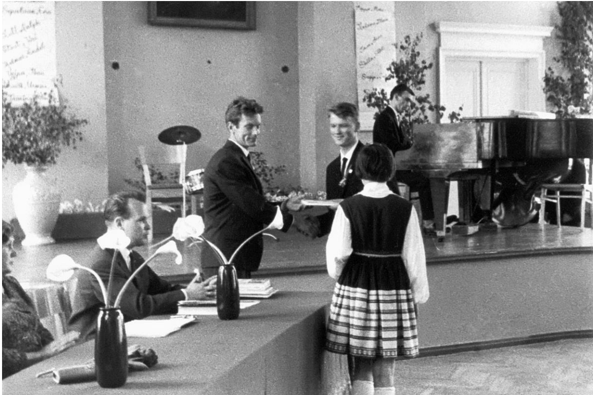
Lõputunnistuste kätteandmine I lennu lõpetajatele 1965.a. kevadel