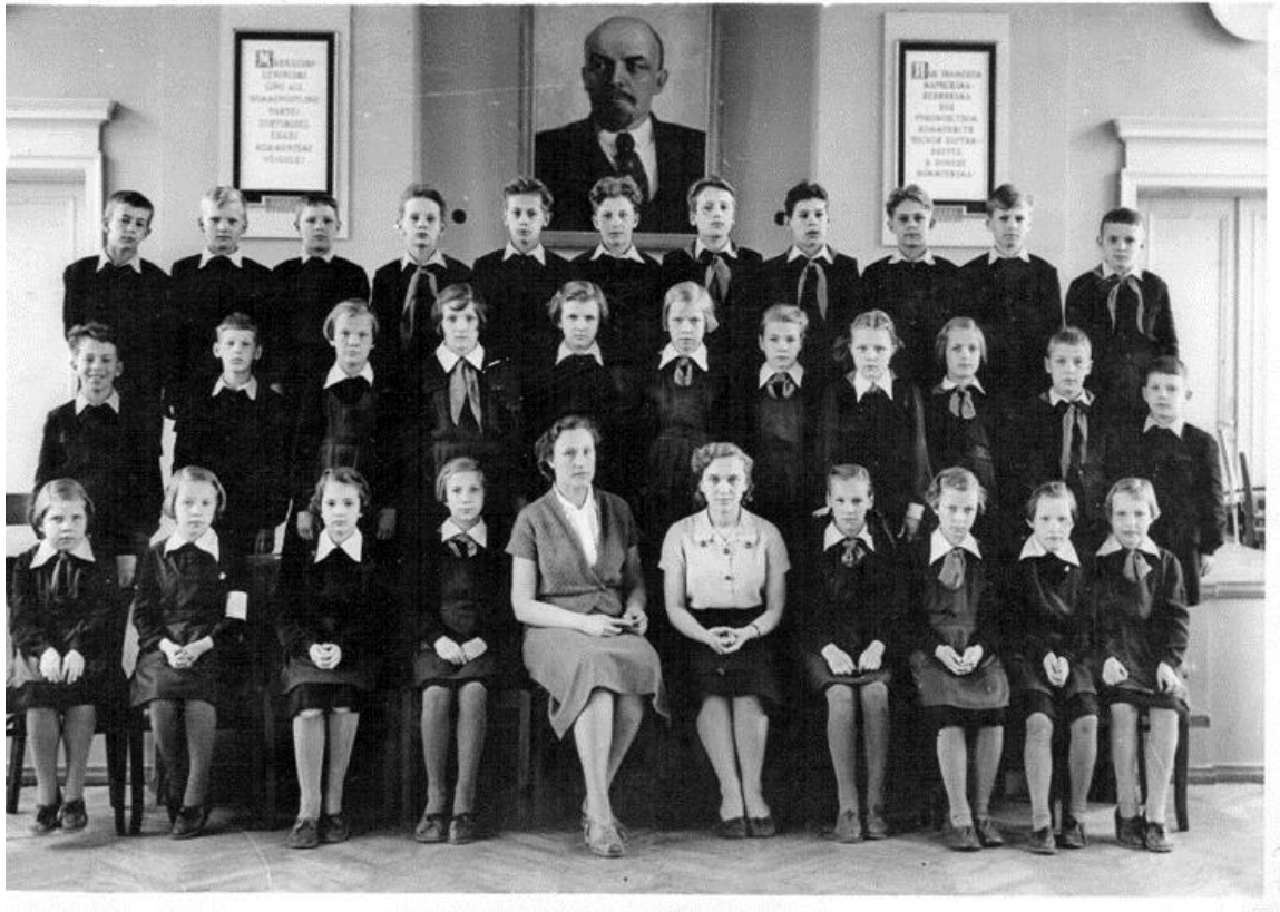
Aasta oli siis 1959