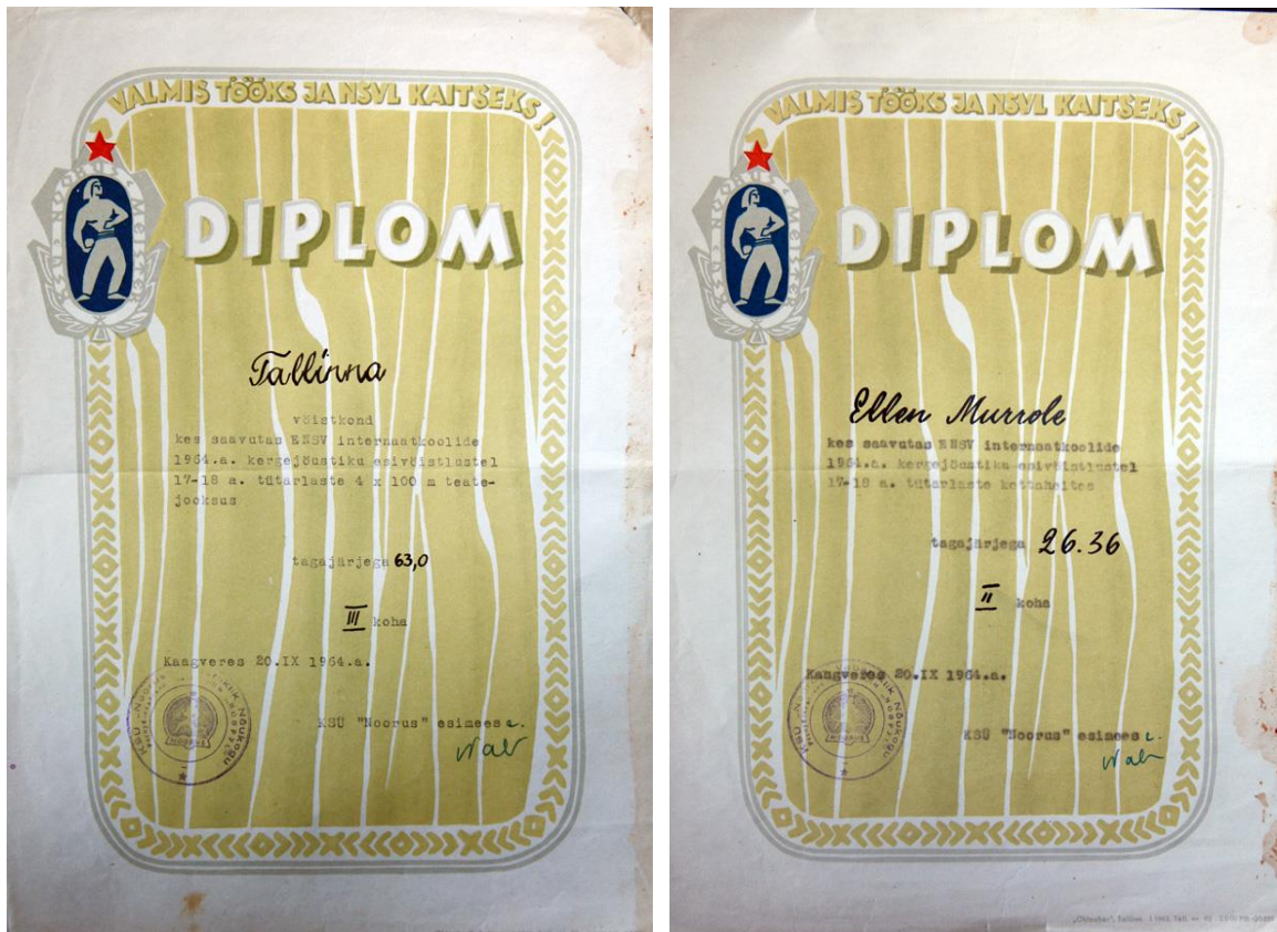
Diplomeid internaatkoolide vahelistelt spartakiaadidelt