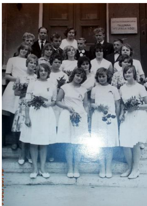
Põhikooli (8. klassi) lõpetajad 1963.a. kevadel