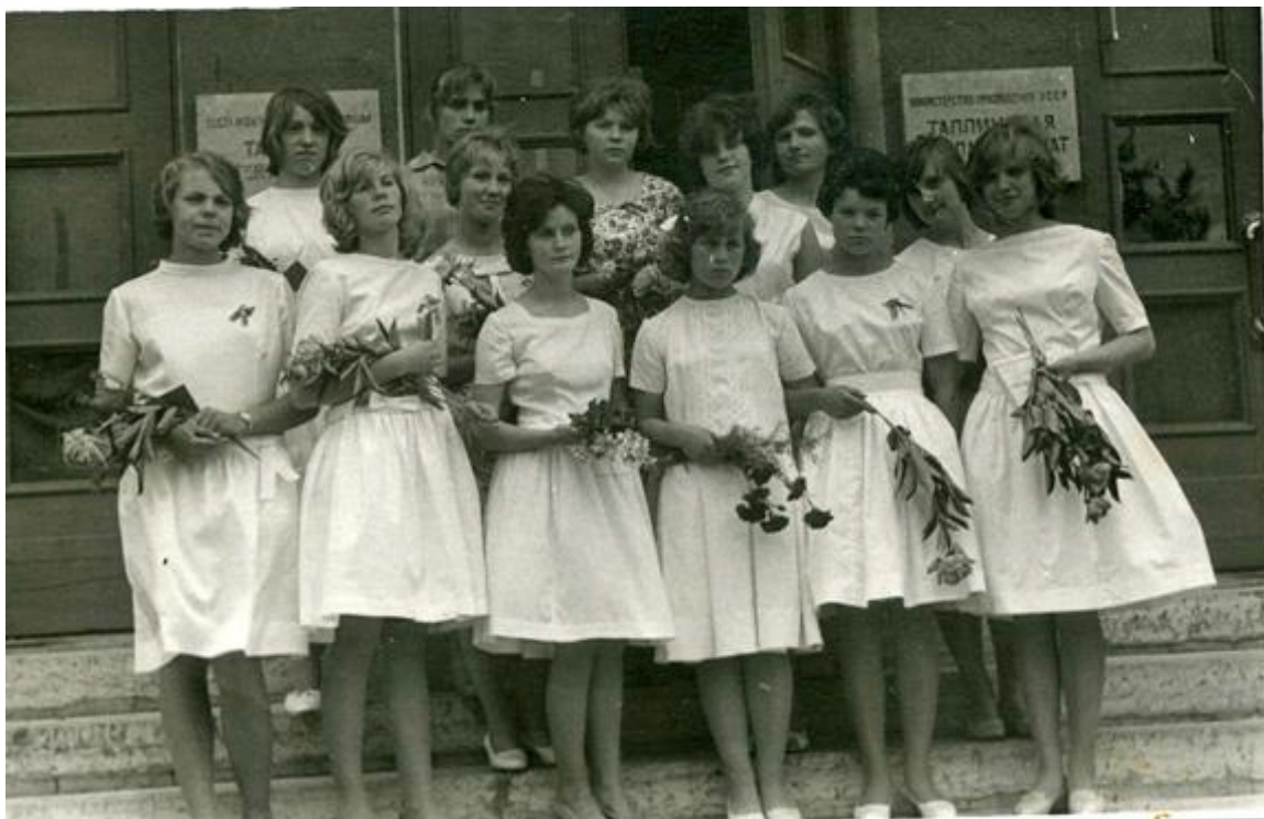
Põhikooli (8. klassi) lõpetanud tüdrukud 1963.a. kevadel